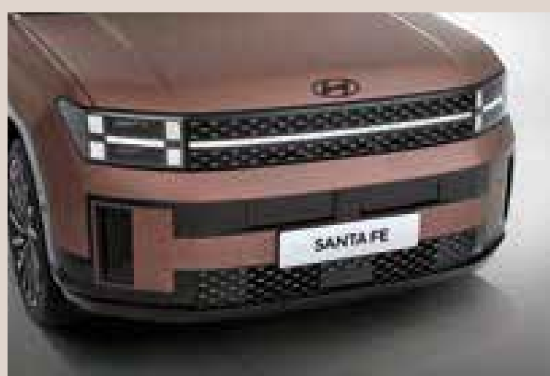
Radiador y parrilla delantera