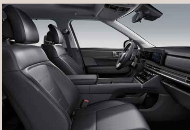
Asientos con tecnología Relaxion