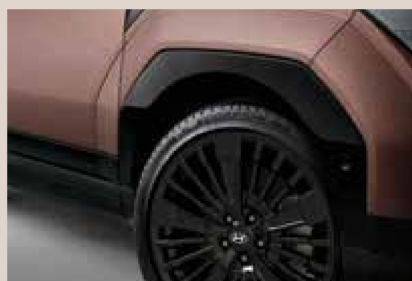
Revestimiento negro de alto brillo